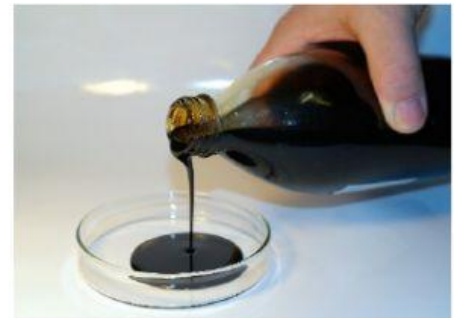
Erdöl aus Deutschland

In Raffinerien wird das Rohöl um die Gruppen – die – mit ähnlichen stufenweise durch Rückkühlung zu kondensieren.