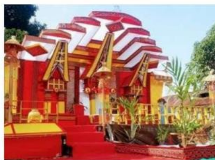
Pemakaian kandaure sebagai dekorasi pelaminan