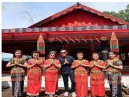
Dekorasi lantang tamu dan pemakaian kandaure dalam upacara pemakaman adat