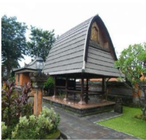
d. Rumah Adat Jineng berasal dari propinsi bali