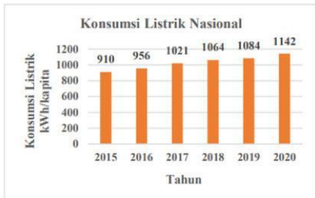
Gambar 2. Grafik Konsumsi Listrik Nasional