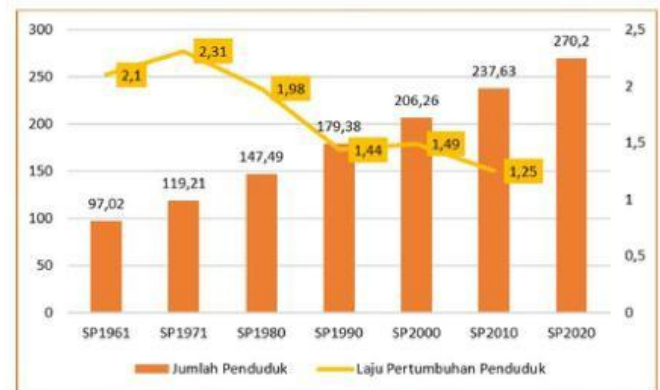
Gambar 3. Grafik Jumlah Penduduk di Indonesia

Seiring meningkatnya jumlah penduduk maka kebutuhan listrik pun akan semakin meningkat sehingga konsumsi listrik akan terus meningkat. Kita tahu bahwa listrik yang kita gunakan sehari-hari berasal dari beragam sumber seperti bahan bakar fosil maupun dari sumber energi terbarukan. Setiap sumber energi memiliki kelebihan dan kelemahannya sendiri, termasuk dampak lingkungan, ketersediaan, dan teknologi yang diperlukan untuk mengubahnya menjadi energi listrik. Seiring dengan perkembangan teknologi dan kepedulian terhadap lingkungan, sumber-sumber energi terbarukan semakin mendapatkan perhatian untuk mengurangi ketergantungan pada bahan bakar fosil dan mengurangi dampak negatif perubahan iklim.