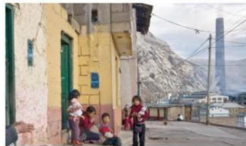
Niños de La Oroya cerca de una planta metalúrgica.

• ¿Qué tipo de transformaciones ha sufrido cada paisaje? ¿Qué impacto tienen estas transformaciones en los espacios que ocupan?