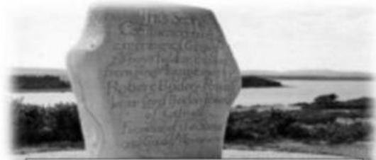
Brownsea Island Scout Stone