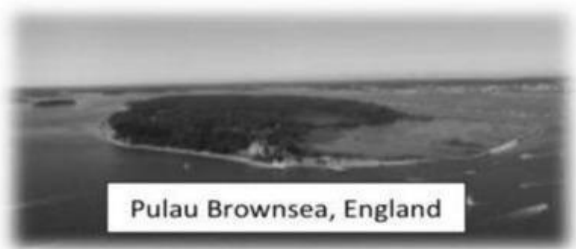
Pulau Brownsea, England

Lokasi Pulau Browsea : https://goo.gl/maps/ywgJbzTvyVp