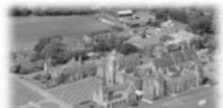
Charterhouse School, England

Pada tahun 1870, beliau telah memasuki sekolah Charterhouse England. Beliau sangat dikenali dalam bidang sukan, lakonan, lukisan dan muzik. Semasa berusia 19 tahun, beliau telah menamatkan pengajian di Charterhouse dan diberi pilihan sama ada untuk bekerja ataupun melanjutkan pengajiannya ke Universiti Oxford. Beliau memutuskan untuk berkhidmat sebagai tentera. Beliau telah berjaya dengan cemerlang dalam peperiksaan pemilihan seorang tentera. Dengan kejayaan ini, beliau tidak perlu memasuki Sandhurst dan terus menjadi pegawai dalam pasukan Hussar ke-13 serta ditempatkan di India pada tahun 1876.