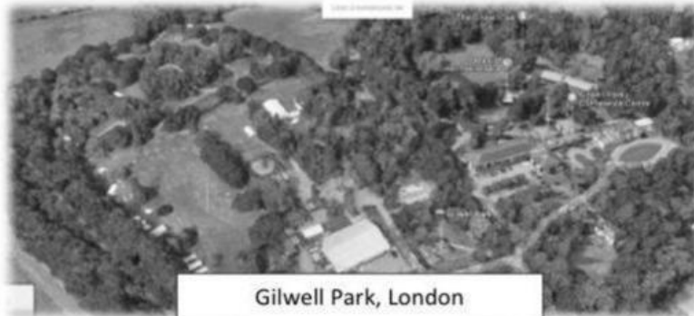
Gilwell Park, London

Semasa tercetusnya Perang Dunia Pertama, kumpulan-kumpulan Pengakap turut mengambil bahagian dalam mempertahankan negara England. Antaranya tugas yang diberikan kepada kumpulan Pengakap ialah mengawasi sepanjang kawasan persisiran pantai. Kumpulan ini digelar Pengakap Laut. Pada tahun 1919, Lord Baden Powell telah menubuhkan sebuah tapak perkhemahan Pengakap yang pertama di dunia dan dikenali sebagai Gilwell Park di London. Gilwell Park merupakan tempat latihan ahli dan pemimpin Pengakap yang terulung di dunia.