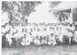
Peserta Kongres Pemuda Indonesia

Selama zaman penjajahan Belanda, Kongres Pemuda Indonesia diselenggarakan tiga kali. Kongres Pemuda Indonesia I berlangsung di Jakarta pada tanggal 30 April – 2 Mei tahun 1926 diikuti oleh semua organisasi pemuda. Namun, Kongres Pemuda Indonesia I belum dapat menghasilkan keputusan yang mewujudkan persatuan seluruh pemuda. Kongres Pemuda Indonesia I merupakan persiapan Kongres Pemuda Indonesia II.