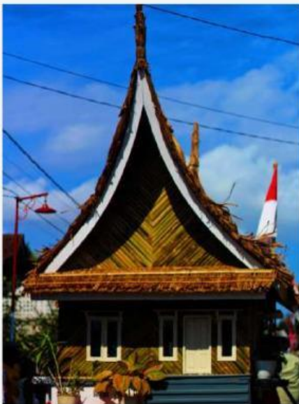
Gambar 2. Replika Rumah Adat Minang Yang Digunakan Untuk Acara Grebeg Suro

Semua partisipan dalam momentum Grebeg Suro menampilkan budaya kreativitasnya dalam berbagai bentuk, meliputi pakaian daerah, rumah adat, tarian daerah, gunung hasil bumi, dan masih banyak lagi kesenian adat budaya Indonesia. Penampilan-penampilan yang diperlihatkan tidak hanya penampilan tradisional, namun juga penampilan-penampilan modern yang dibawa oleh anak muda seperti dance, tari kontemporer, kontes sound, dan kreativitas lainnya. Grebeg Suro dikonsepsi dengan penampilan-penampilan yang ditampilkan di titik awal pemberangkatan, sepanjang jalan parade, dan titik akhir. Parade Grebeg Suro melewati rute yang telah ditentukan yakni di titik awal pemberangkatan yaitu Lapangan Desa Sukoreno sampai titik akhir yaitu di halaman Situs Tanah Reco. Parade diawali dengan pelepasan oleh Kepala Camat Umbulsari dengan regu kehormatan dari Perangkat Pemerintah Desa Sukoreno sebagai regu pertama.