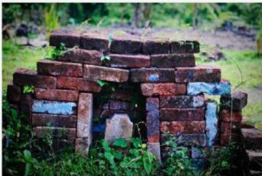
Gambar 4. Batu Bata Peninggalan Kerajaan Majapahit

Tahun 2006 tepatnya di Desa Sukoreno Kecamatan Umbulsari Kabupaten Jember ditemukan peninggalan bahan bangunan yang diduga bahan bangunan tersebut adalah bahan bangunan kerajaan yakni berupa puluhan batu bata berukuran besar. Selang waktu kemudian, datanglah para ilmuwan dan peneliti sejarah untuk mengulik asal muasal penemuan peninggalan bahan bangunan kerajaan tersebut. Setelah melalui proses yang panjang pada akhirnya para ilmuwan dan peneliti sejarah serta sesepuh warga Desa Sukoreno menerangkan bahwa peninggalan bahan bangunan kerajaan tersebut adalah peninggalan kerajaan Majapahit sekitar abad 14 Masehi. Dinamakan situs Tanah Reco karena situs peninggalan Kerajaan Majapahit tersebut ditemukan di daerah Jalan Reco Gang 6, Desa Sukoreno, Kecamatan Umbulsari, Kabupaten Jember.