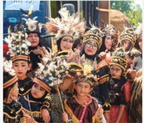
Gambar 3. Suku Adat Papua Yang Digunakan Untuk Acara Grebeg Suro

Tujuan diadakannya Grebeg Suro tidak hanya sekedar memperingati momentum tanggal 1 Suro dan hari ulang tahun Republik Indonesia saja, akan tetapi juga menjadi sebuah upaya melestarikan adat dan budaya yang mulai tersisihkan oleh kemajuan zaman. Grebeg Suro yang digelar di Desa Sukoreno mengkolaborasikan budaya tradisional dan budaya modern. Hal tersebut menjadi harapan besar Pemerintah Desa Sukoreno beserta seluruh Masyarakat agar tradisi Grebeg Suro menjadi kearifan lokal yang dikenal oleh masyarakat luas.