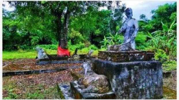
Gambar 4. Situs Tanah Reco

Situs Tanah Reco dikelola oleh Pemerintah Desa Sukoreno agar menjadi cagar budaya Desa Sukoreno dengan cara mereplikanya. Setelah proses replika selesai, kemudian diadakan kegiatan peresmian. Peresmian Situs Tanah Reco dihadiri oleh Kepala Dispemades Kabupaten Jember, Camat Umbulsari, Pemerintah Desa Sukoreno, Sesepuh Warga Desa Sukoreno, Tokoh Agama, dan Warga Desa Sukoreno. Peresmian ini sebagai simbol harapan bahwa Situs Tanah Reco Peninggalan Kerajaan Majapahit menjadi cikal bakal destinasi wisata budaya dan religi serta menambah kerukunan antar umat beragama yang tentunya dapat dikenal dan dilestarikan oleh seluruh masyarakat Indonesia