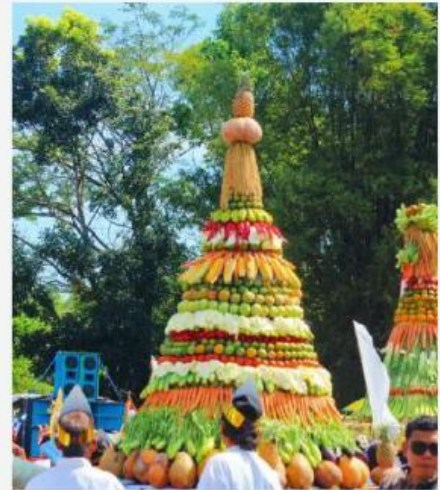
Gambar 1. Gunungan Hasil Bumi Yang Digunakan Untuk Acara Grebeg Suro

Grebeg Suro merupakan tradisi yang dilaksanakan setiap tahun sekali oleh masyarakat Desa Sukoreno. Tradisi Grebeg Suro dikemas dengan tema dan konsep yang berbeda-beda setiap tahunnya. Tema dan konsep yang dibentuk menyesuaikan kondisi dan situasi yang terjadi, namun yang tidak pernah terlewatkan dalam tradisi Grebeg Suro yakni perwujudan “Gunungan Hasil Bumi” dan parade pemeluk agama/kepercayaan yang berbeda-beda. Parade tersebut sebagai bentuk gambaran masyarakat Desa Sukoreno yang memeluk agama dan kepercayaan yang berbeda-beda, diantaranya pemeluk agama Islam, Hindu, Katholik, dan kepercayaan Sapta Dharma.