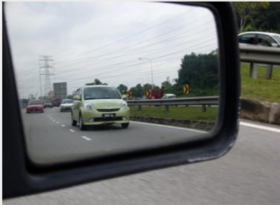
Gambar 3. Bayangan pada spion

Jawablah pertanyaan di bawah ini dengan menerapkan rumus yang telah kalian ketahui!