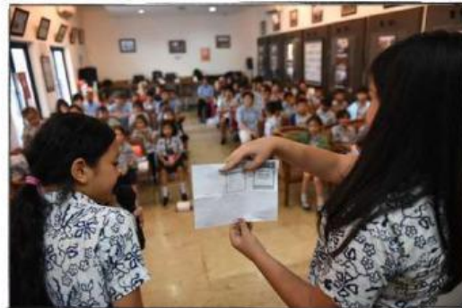
Gambar 6: Memberikan pendapat dan mendengarkan pendapat teman sekelas