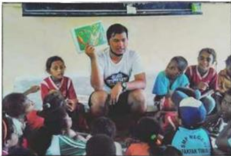
Gambar 1: Mengajar tanpa membeda-bedakan

Mengandung makna bahwa kemanusiaan haruslah diutamakan dalam aktivitas keseharian masyarakat Indonesia. Terlebih lagi negeri ini berdiri di atas berbagai macam perbedaan, seperti yang tersurat dalam semboyan negara Indonesia, “Bhinneka Tunggal Ika”. Nilai kemanusiaan menjamin kita untuk memperlakukan sesama manusia dengan adil tanpa membedakan suku, ras, golongan, dan agama. Perbedaan ini harus selalu didukung dengan sikap kemanusiaan yang penuh dengan kasih sayang dan moral.