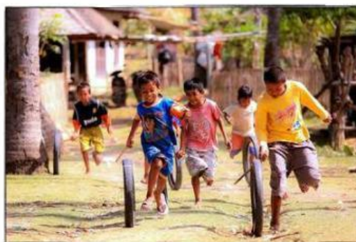
Gambar 7: Bermain tanpa membedakan

Peserta didik dapat menjunjung tinggi persamaan hak untuk semua individu tanpa memandang perbedaan jenis kelamin, suku, agama, ras, atau latar belakang sosial ekonomi. Mereka dapat memperlakukan semua orang dengan adil dan memberikan kesempatan yang sama kepada semua.