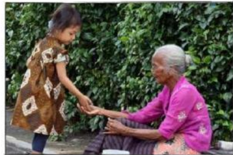
Gambar 2: Sikap kemanusiaan yang beradab