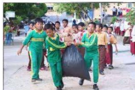
Gambar 4: Melakukan Gotong-royong