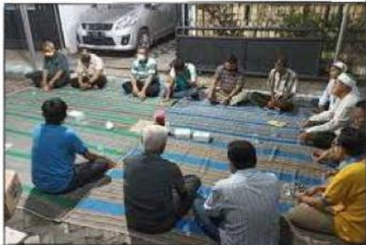
Gambar 5: Melakukan musyawarah

Hal ini menggambarkan masyarakat Indonesia harus mengutamakan musyawarah untuk menyelesaikan permasalahan atau saat membicarakan suatu hal. Dengan bermusyawarah, diharapkan masalah atau hal yang sedang dibicarakan dapat diselesaikan dengan baik tanpa harus menyebabkan konflik atau masalah lebih lanjut. Penerapan nilai sila keempat dilakukan dengan tidak memaksakan pendapat dan kehendak kepada teman, mendengarkan pendapat orang lain, mengambil keputusan untuk kepentingan bersama lewat jalan musyawarah. mengutamakan kepentingan bersama di atas kepentingan pribadi, serta mempertanggungjawabkan keputusan yang diambil.