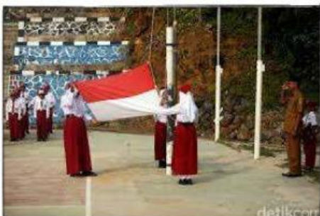
Gambar 3: Melaksanakan Upacara

Semboyan “Bhinneka Tunggal Ika” atau “berbeda-beda tapi tetap satu” adalah semboyan yang paling tepat untuk mendeskripsikan keberagaman Indonesia, sekaligus menunjukkan bahwa sila ketiga itu benar adanya. Mendeskripsikan karakter terbina bila terjadi persatuan antar rakyat Indonesia yang saling melengkapi dan saling membantu sebagai akibatnya terjadi kehidupan yang humanis, walaupun berbeda-beda namun tetap satu jua. Penerapan sila ketiga dilakukan dengan menjaga kerukunan dengan teman dan guru di sekolah, Berteman tanpa memandang status sosial ekonomi, agama, suku, ras, dan golongan. menunjukkan rasa cinta tanah air dengan selalu mengikuti upacara bendera dengan tertib dan khidmat, Menghargai dan menghormati perbedaan, tidak melakukan hal-hal yang memicu pertengkaran, serta menjaga kebersihan lingkungan bersama warga sekolah.