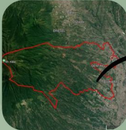
Kecamatan Dau Tahun 2014