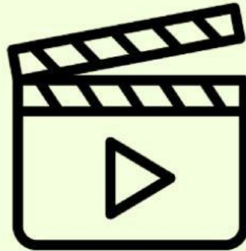
Struktur dan Organel Sel

Perhatikan Materi Persentasi berikut ini !