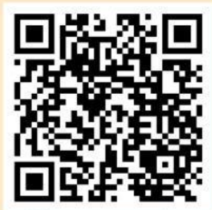
Video Cara Membuat Piktogram

berkenalan dengan kue tradisonal lombok dibawah ini