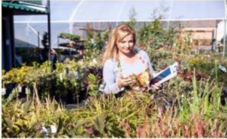
Pengusaha Tanaman Hias