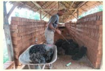
Pengerajin Batu Batu