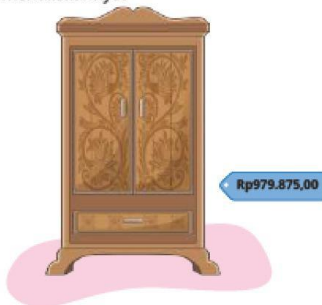
Gambar 9.2 Lemari Jepara

Pada hari Minggu, Nisa mengantar Ibu membeli lemari di Jepara, Jawa Tengah. Jepara merupakan kota di Jawa Tengah yang terkenal dengan produksi mebel. Tahukah kamu? Mebel Jepara terkenal sampai ke mancanegara karena ukiran yang diproduksi oleh pengrajin mebel di sana mempunyai karakteristik yang khas dan kualitas terjamin. Harga mebel yang ada di Jepara beraneka ragam. Nisa memberikan saran kepada ibu terkait lemari yang dipilihnya. Lemari yang dipilih Nisa seharga Rp979.875,00 atau bisa dibaca “sembilan ratus tujuh puluh sembilan ribu delapan ratus tujuh puluh lima rupiah”. Pernahkah kalian melihat angka-angka seperti harga lemari tersebut? Apakah kalian masih ingat harga sepatu atau peralatan sekolah serta pakaian kalian? Di manakah kalian menemukan angka-angka lain? Bisakah kalian membaca dan menuliskannya?