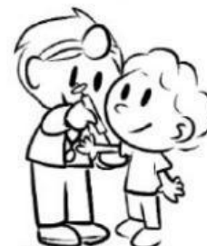
Derecho a la salud.