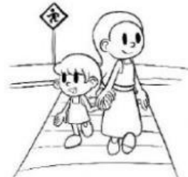
Cruzar la calle

12-13.-Elige cual acción tiene una consecuencia negativa escribe NO y lo bueno escribe Si.