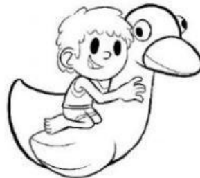
Derecho a tener un salvavidas.