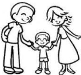
Derecho a una familia.