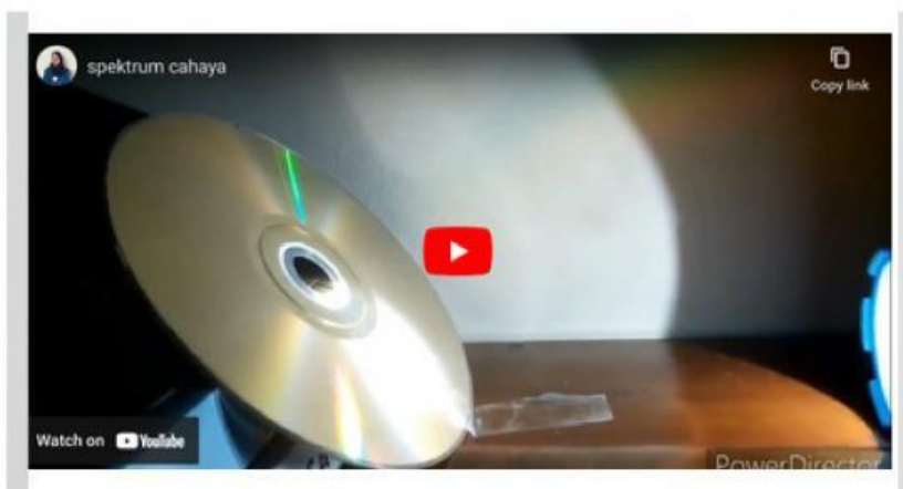
Video 1. Spektrum Cahaya

Perhatikan video dibawah ini dengan seksama bagaimana cahaya putih melewati permukaan CD.