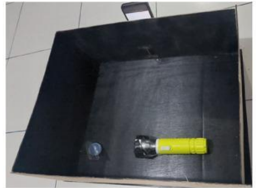
Gambar 2. alat spektrofotometer sederhana