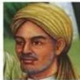
Sunan M.Malik Ibrahim