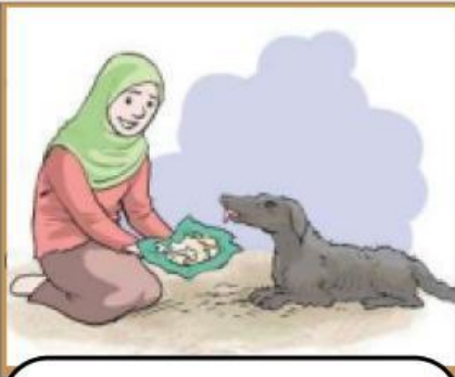
Dakwah dengan kelembutan

Peran Tokoh Ulama dalam Penyebaran Islam di Indonesia (Metode Dakwah Islam Oleh Wali Songo di Tanah Jawa)