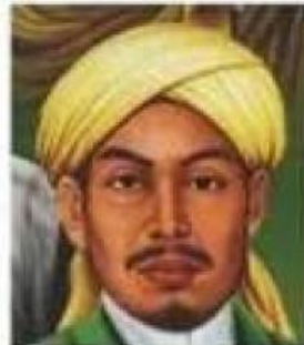
Sunan Gunung Jati