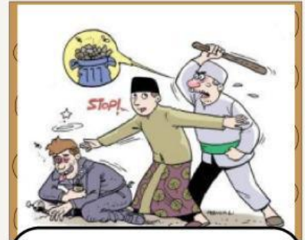
Dakwah dengan metode yang baik