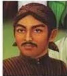
Sunan Kali Jaga