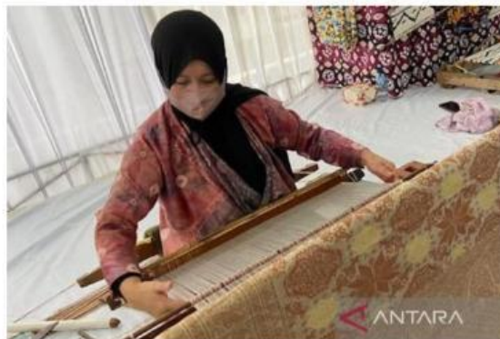
Gambar 1. Penenun Songket Palembang

Hai teman-teman ! Kalian pasti pernah dengar tentang Songket Palembang, kan? Berikut simak sejarah singkat Songket Palembang ! Kota Palembang dikenal sebagai penyumbang karya warisan budaya khas nusantara, salah satunya ialah kain tenun Songket. Songket Palembang juga ditetapkan sebagai warisan budaya tak benda Indonesia pada tahun 2013 oleh Kementerian Pendidikan dan Kebudayaan, masuk dalam domain keterampilan dan kemahiran kerajinan tradisional (Ogest, 2023). Menurut cerita rakyat yang menyebar secara turun temurun di Palembang, kain songket bermula dari perdagangan zaman dahulu di antara Tiongkok dan India. Orang Tionghoa menyediakan benang sutera, sedangkan orang India menyumbang benang emas dan perak; maka, jadilah songket. Kain songket ditenun pada alat tenun bingkai Melayu. Pola-pola rumit diciptakan dengan memperkenalkan benang-benang emas atau perak ekstra dengan penggunaan sehelai jarum leper (Trisiah, 2016).