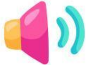
Bahasa Banjar dari Suku Banjar

Nah, setelah kalian menonton video dan belajar dari tautan di atas, kalian sudah tahu kan kalau Indonesia memiliki banyak sekali suku yang tersebar di seluruh wilayah Indonesia. Nah, sekarang coba klik gambar di bawah ini untuk mendengarkan beberapa bahasa dari suku yang berbeda di Indonesia.