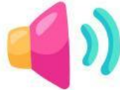
Bahasa Jawa dari Suku Jawa