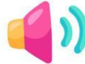
Bahasa Lani dari Suku Dani

Dari beberapa contoh percakapan berbagai bahasa daerah tersebut, apakah kalian bisa mengerti semuanya?