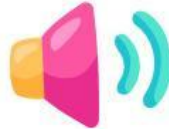
Bahasa Minang dari Suku Minang