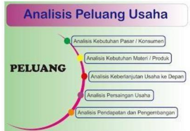
Gambar 2.1 Analisis Peluang Usaha

Sebagai ilustrasi dapat dilihat dalam video berikut,