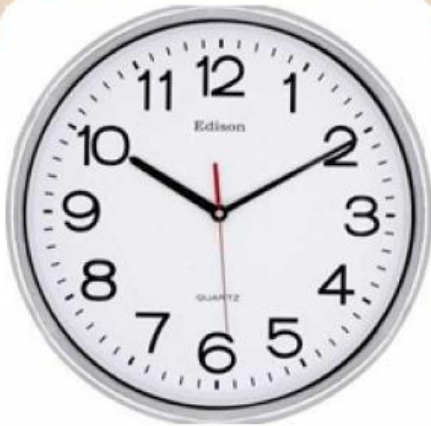
Gambar 1. Gerakan jarum jam merupakan contoh rotasi.

dengan O(0,0) sebagai pusat rotasi dan a^\circ sebagai sudut rotasi.