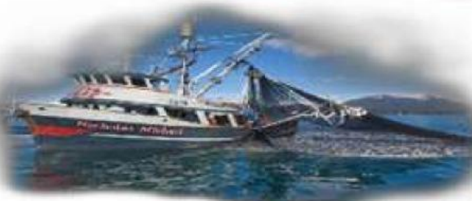
Menggunakan pukat harimau