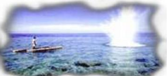
Menggunakan bahan peledak