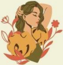
सुंदर / खूबसूरत