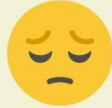
उदास / दुखी