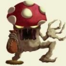
कुरूप / बदसूरत