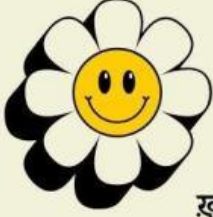
खुश / सुखी