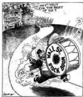
"Getting Ahead of the Band Wagon" Los Angeles Times, November 24, 1928