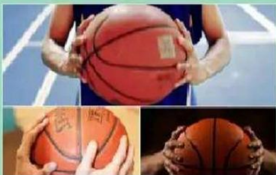
Tugas Praktik Bola Basket PJOK Kelas X Semester 1 TP 2021/2022

tugas pjok, tugas praktik pjok, tugas mempraktikkan teknik bola basket, contoh soal tugas praktik pjok.