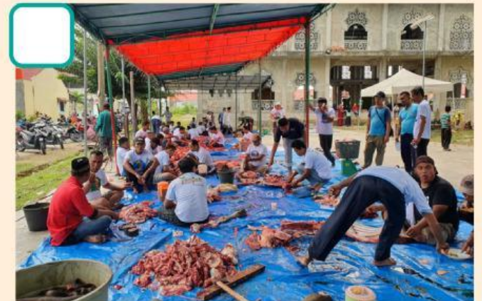
Pemotongan hewan kurban