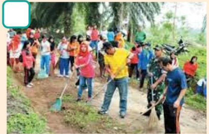
Membersihkan jalan desa