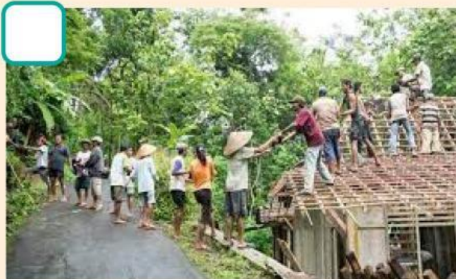
Membangun rumah tetangga