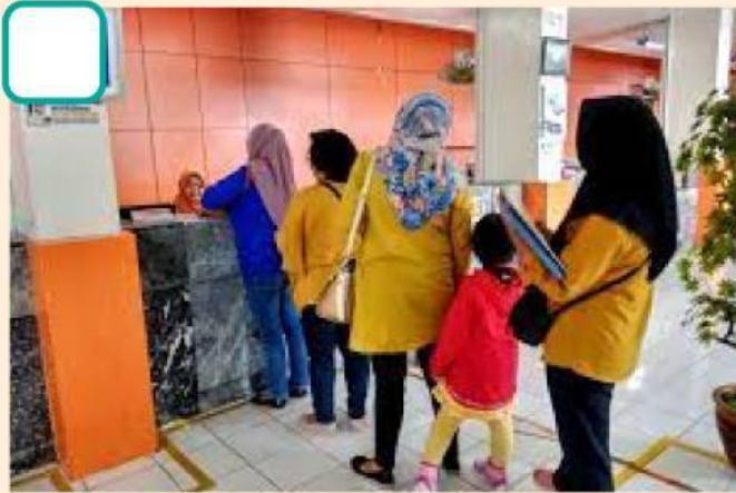
Antre di kantor POS

Berilah tanda ceklis ✓ pada gambar yang menunjukkan kegiatan gotong royong di masyarakat.