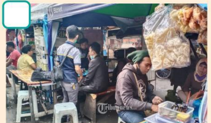
Makan di warung