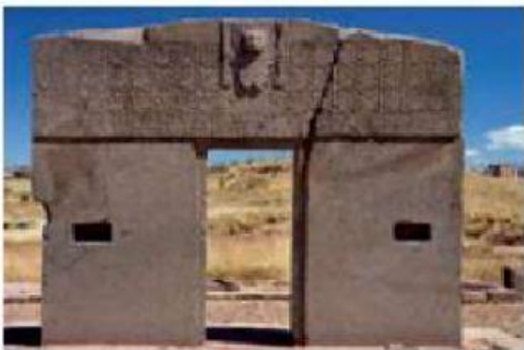
Puerta del Sol, Tiahuanaco.