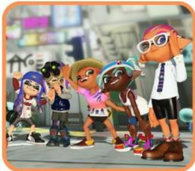
Imatge de Nintendo