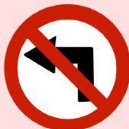
Dilarang Belok Kiri