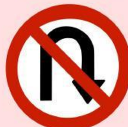
Dilarang Putar Balik