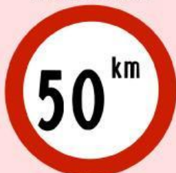
Batas Kecepatan Maksimal