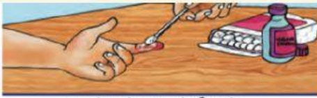
மஞ்சள் மருந்திடல் (Providone-iodine).