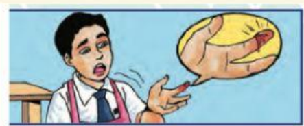
கைவிரலில் சிமி காயம்.