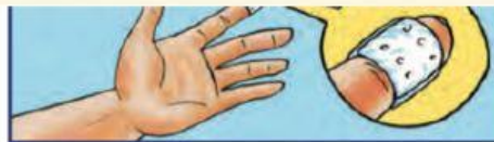
காயத்திற்கு மருந்து ஒட்டி (Handy plaster) போடவும்.