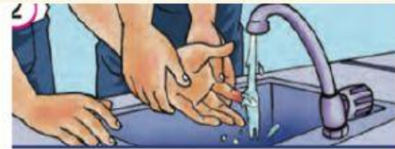
காயத்தை நீர் கொண்டு கழுவவும்.