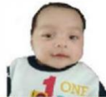
Air kencing bayi laki-laki berumur di bawah 2 tahun yang hanya minum ASI