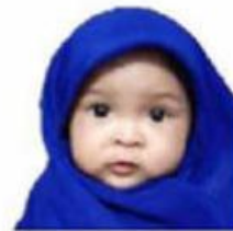
Air kencing bayi perempuan berumur di bawah 2 tahun yang hanya minum ASI