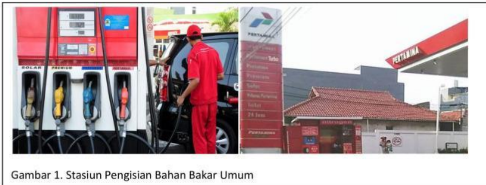
Gambar 1. Stasiun Pengisian Bahan Bakar Umum

Anda tentu sudah tidak asing lagi dengan gambar di atas. Gambar tersebut merupakan salah satu aktivitas yang terjadi di Stasiun Pengisian Bahan Bakar Umum (SPBU). SPBU adalah tempat di mana kendaraan bermotor bisa memperoleh bahan bakar. Di Stasiun Pengisian Bahan Bakar, pada umumnya menyediakan beberapa jenis bahan bakar. Misalnya: Bensin dan beragam varian produk Bensin (Pertalite, Premium, Pertamina, Pertamina Plus), Solar, Dexlite, Pertamina Dex. Jenis-jenis bahan bakar tersebut berasal dari sumber yang sama, yaitu minyak bumi.