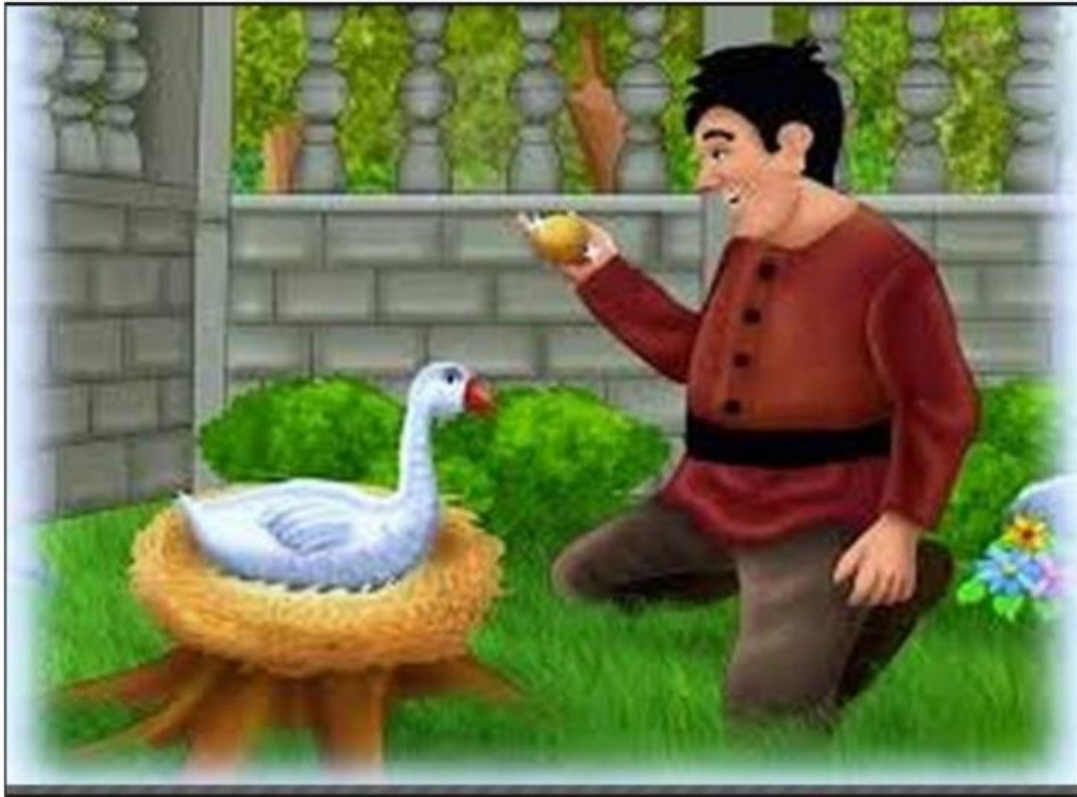
Gambar 1. Angsa mengeluarkan telur emas

Angsa setiap hari mengeluarkan telur emas sampai berjumlah selusin. Namun, petani masih belum puas. "Aku kaya raya! Tapi, aku ingin angsa mengeluarkan lebih banyak telur emas agar aku cepat kaya," kata petani.