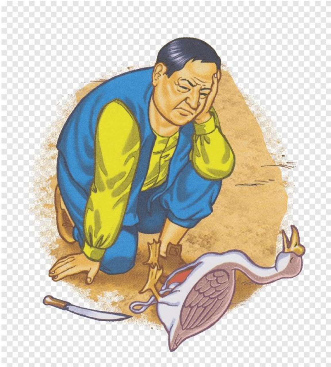
Gambar 2. Angsa mati dan petani menyesal.