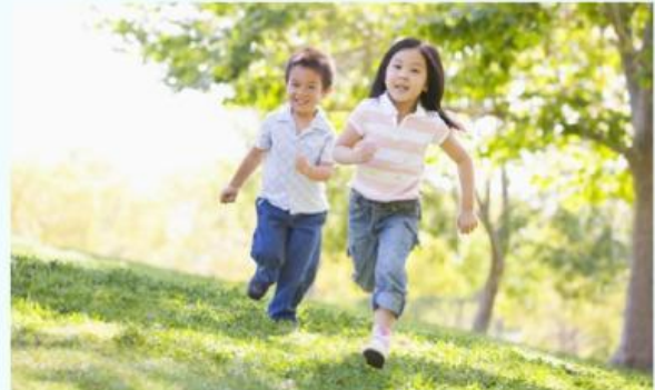
Gambar 1.8 Anak Berlari