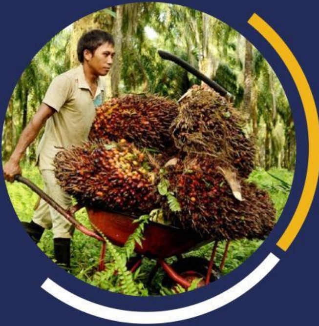
Gambar 1. Gerobak Sorong Angkat Sawit

Pernahkah kamu melihat orang yang mengangkut kelapa sawit atau barang-barang yang berat dengan menggunakan gerobak dorong? Tahukah kamu, ternyata dengan menggunakan gerobak dorong, memindahkan barang yang berat lebih mudah daripada mengangkat dengan tangan. Mengapa demikian? Agar memahaminya, ayo kita pelajari materi tentang usaha dan pesawat sederhana dalam kehidupan sehari-hari dengan penuh semangat