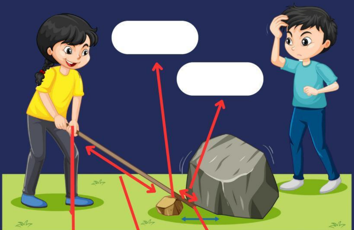
Gambar 2. Science Experiment