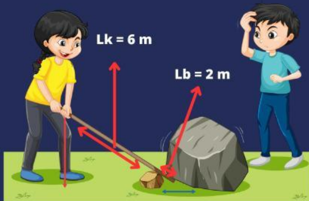
Gambar 4. Science Experiment

Yolanda ingin memindahkan batu besar menggunakan tongkat besi seperti terlihat pada gambar di samping, maka keuntungan mekanis dari kegiatan tersebut: