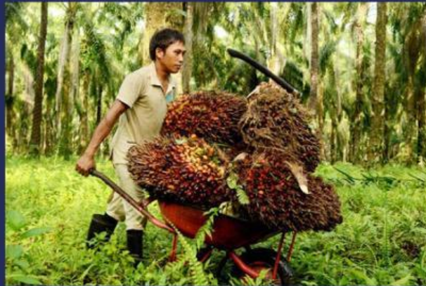
Gambar 5. Gerobak Sorong Angkat Sawit

5. Perhatikan gambar berikut ini dan lengkapi kalimatnya dengan kata yang tepat!