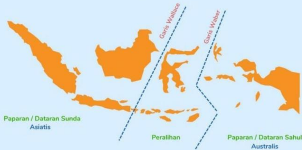
Peta Persebaran Flora dan Fauna di Indonesia