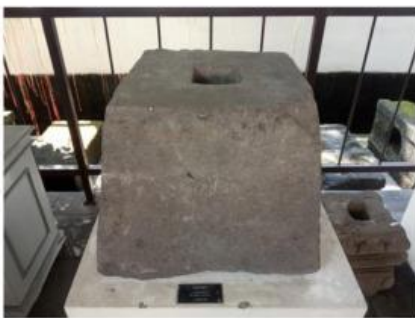
Gambar 3. Umpak Batu