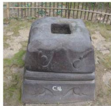
Gambar 4. Umpak Keraton Kerto