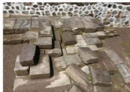
Gambar 6. Pondasi gapura atau pintu gerbang Keraton Kerto