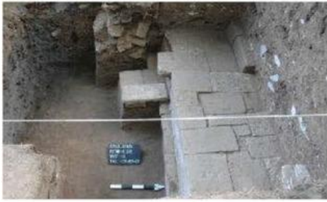
Gambar 7. Pondasi benteng cepuri Keraton Kerto