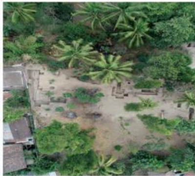
Gambar 1. Siti Inggil Keraton Kerto