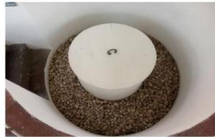
Gambar 2. Sumur Gumilang