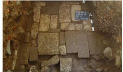
Gambar 8. Struktur bangunan Keraton Kerto