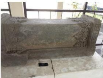
Gambar 5. Batu Candi