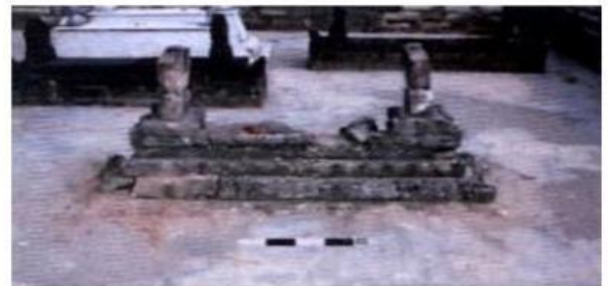
Gambar 10. Makam Kyai Kategan

Tuliskan hasil indentifikasi kalian di bawah ini !