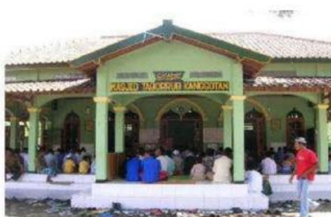
Gambar 9. Masjid Taqqorub (Masjid Agung Keraton Kerto