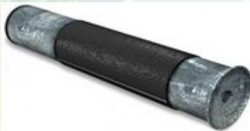
Mikroskop buatan Zacharias Janssen

Penemuan Zacharias Jansen, seorang berkewarganegaraan Belanda sekitar tahun 1580-an, yang dibantu ayahnya ketika membuat sebuah mikroskop sederhana dengan cara meletakkan dua buah lensa cembung pada dua ujung tabung. Temuan Zacharian Jansen telah mendorong para ahli lainnya untuk melakukan penelitian lebih lanjut.