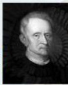
Robert Hooke (1635 - 1703)