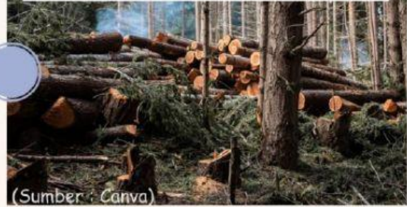
Penebangan hutan secara liar