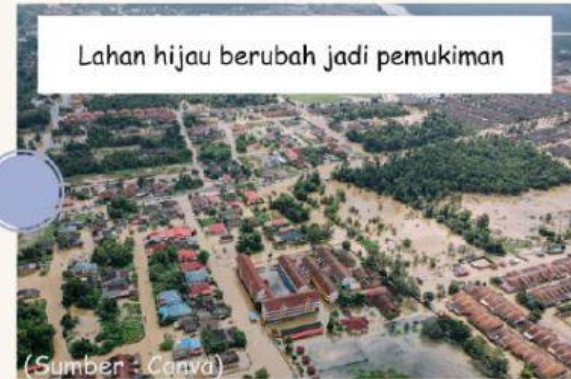
Lahan hijau berubah jadi pemukiman