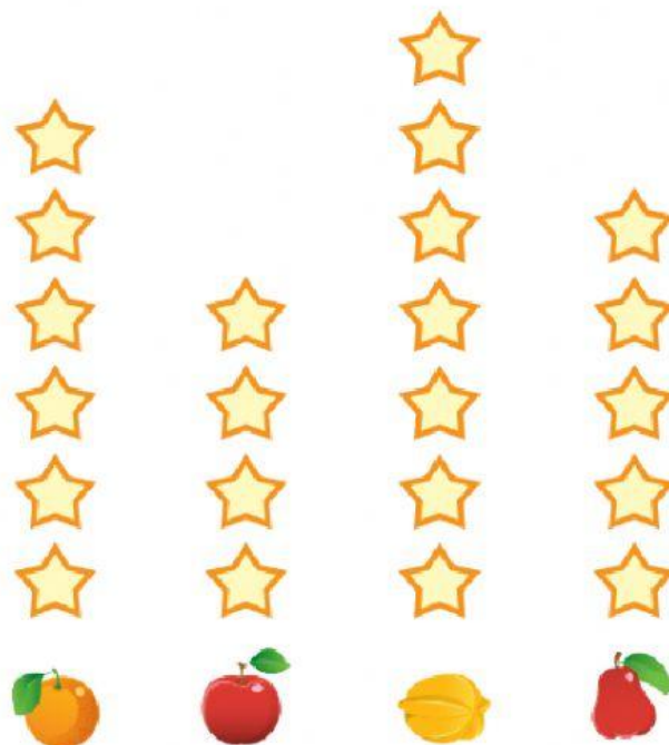
Diagram Buah Kesukaan

1. Diagram berikut menunjukkan jenis buah kesukaan anak-anak.