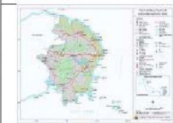
Kab. Belitung Timur