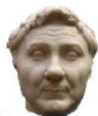
1 Gneo Pompeo

2 Appartiene alla più antica aristocrazia romana, alla famiglia Julia, che si vanta di essere discendente di Iulo, figlio di Enea. È molto amato dalla plebe ed è a capo della fazione dei Popolari.