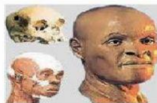
Luzia, o fóssil mais antigo encontrado na América. www.google.com/images .

Utilizando programas específicos de computador, os pesquisadores fizeram uma reconstituição da provável fisionomia de Luzia, que teria vivido há cerca de 11.500 anos. Isso mostra que a arqueologia, ciência que lida com um passado tão distante, muitas vezes recorre a instrumentos e a uma tecnologia bastante avançada.