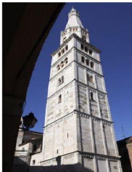
La Torre Ghirlandina