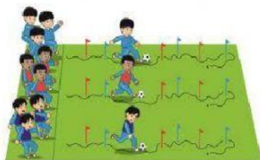
Gambar 1.21. Aktivitas pembelajaran mengenai bola dengan metode bermain yang disebut sepak bola