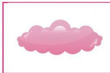
LA NUBE ROSA