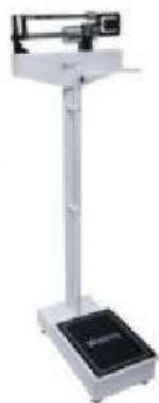
Balança Mecânica Antropométrica