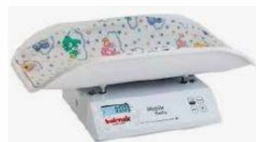
Balança Digital Neonatal