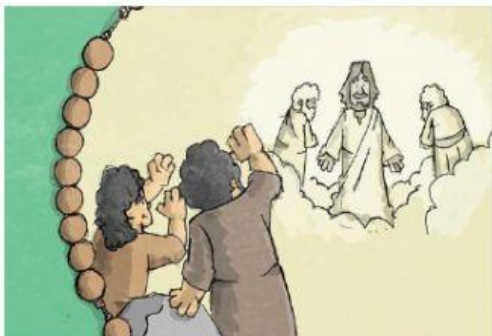
KI JE V KANI NAREDIL PRVI ČUDEŽ