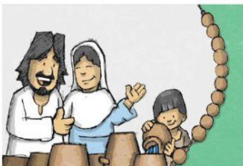
KI JE POSTAVIL SVETO EVHARISTIJO