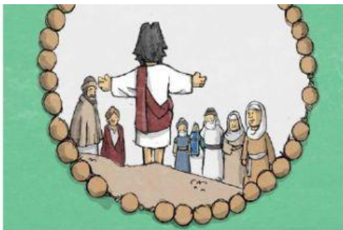
KI JE NA GORI RAZODEL SVOJE VELIČASTVO