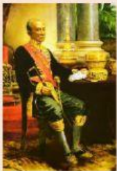
รัชกาลที่ 4