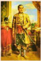
รัชกาลที่ 1