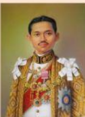
รัชกาลที่ 7