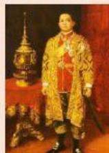
รัชกาลที่ 6