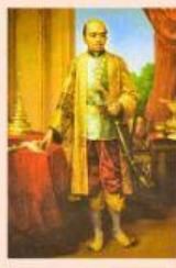
รัชกาลที่ 2