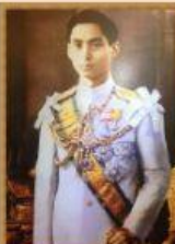
รัชกาลที่ 8