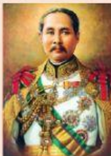
รัชกาลที่ 5