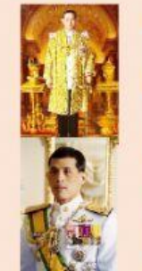
รัชกาลที่ 9-10